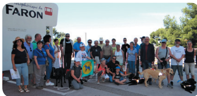
L'équipe de la délégation au Mont Faron

Nous privilégions aussi les rencontres entre nous, elles ont un franc succès avec entre autres la galette des rois et le pique-nique partagé au Mont Faron.