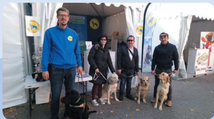
Notre stand à la Foire de Marseille

Dans l'ensemble, nous faisons notre maximum pour répondre présents. En 2018, nous avons réalisé de nombreuses sensibilisations, autant auprès d'enfants qu'auprès d'adultes, dans des entreprises par exemple. Nous étions présents à la Foire Internationale de Marseille, ainsi qu'à l'évènement Un Chien dans la Ville et le salon Autonomic.