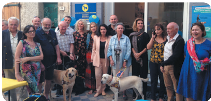
Inauguration du local

Cette année aura été marquée par notre installation au cœur de la ville de Toulon. L'inauguration du local de la délégation en septembre a déplacé de nombreux partenaires, acteurs et témoins de notre action dans le département. Nous avons créé un lieu de travail mais aussi un lieu de rencontre accessible à tous.